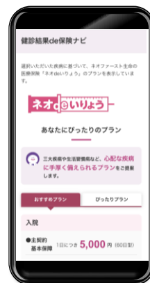
ユーザーにぴったりのプランが提示される

また、本年7月28日より無料で提供している健診結果改善サポートアプリ「Neoコーチ」においても、健康課題・不安解消のユーザー体験の一要素となる「健康不安を経済面から支える手段として納得度の高い医療保険プランの提案を受けることができる」という体験を追加するため、「健診結果de保険ナビ」の機能を実装いたします。