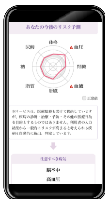
入力した健康診断結果からリスクを表示