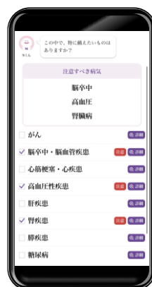
注意すべき疾病をもとに備えたい疾病を選ぶ