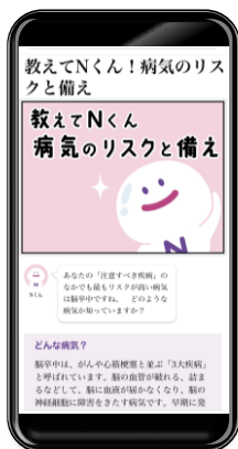
ユーザーの注意すべき疾病について説明を受ける