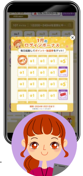
Neo コーチ専属ヘルスコーチ ウェル美

ユーザーアンケートで、アプリに対するお困りの点・不便な点として「報告を忘れてしまう」との声が寄せられていましたが、このログインボーナス機能により、ユーザーさまの健康改善取り組みの継続をより強力に支援することができるようになりました。